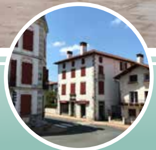
8-9.or Bizilekuen sortzea herri barnean