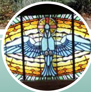
6-7.or Kaperaren berritzea