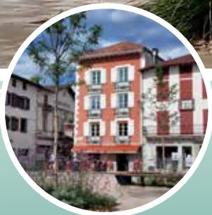
4-5.or herri barnea aldaturik