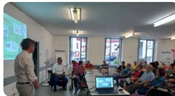
BILKURA PUBLIKOIA GUREKIN ELKARTEAREKIN 2023KO UZTAILERAN.

Lehenengo lantegiaren lekuan, alokatzeko 8 T2 pribatu proposatuko dira adinekoendako (65 urtekoak eta goitikoak). Leku komun gehigarri batzuk erabiltzen ahalko dira jendearen errezibitzeko eta aktibitateak edo ateraldiak antolatzeko, partaidetza izenpetu dugun Gurekin elkarteko profesional kalifikatuek kudeaturik.