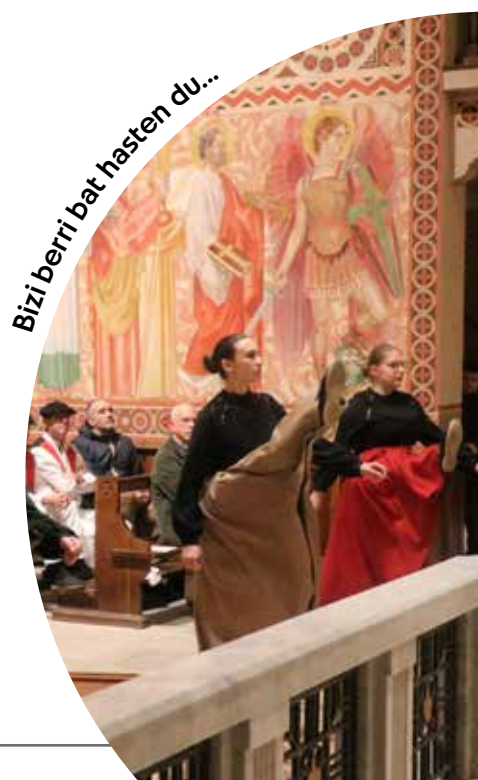
Biziberritza hasten du...

jarduerak hartuko eta garatuko ditugu (kontzertuak, hitzaldiak, historia, arteak...).