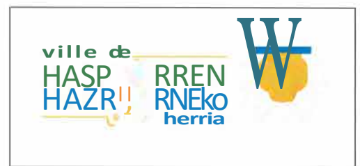
TABLEAU DU CONSEIL MUNICIPAL (art. L. 2121-1 du code général des collectivités territoriales - CGCT)